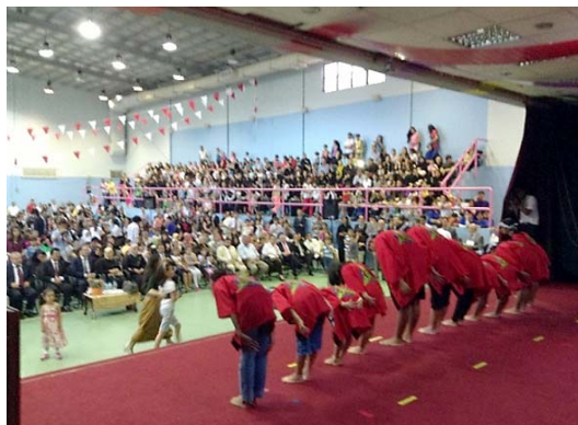
トルコ校交流会での発表の様子

例年4月下旬にジッダにあるインター校（約10か国）が集まって、それぞれの学校の発表を行う。和太鼓・三線の演奏を行ってきた。