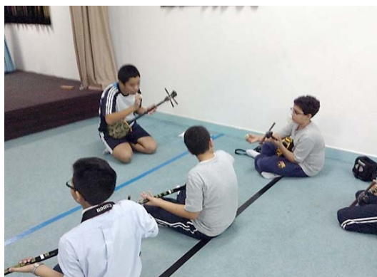
AGS との交流で三線を教える生徒

現地校 AGS (Advanced Generations Schools) との交流（男子校）。カナダ人教員の担当するクラスが日本についての学習をしており、交流が実現した。交流プログラムの中で、「和太鼓、三線体験コーナー」を設け、本校中学部生徒が担当した。