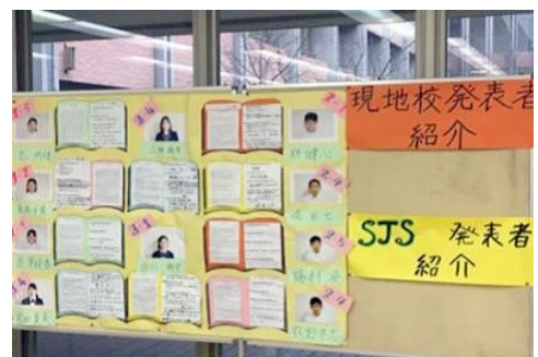
正面玄関に飾られた発表者のコメント

こういった行事を皆で作ろうとする姿勢や日中友好への熱い思いが、赴任3年目により進化した形となって表れたことがとても嬉しく感じた。日本人学校の中で伝統行事をいかに引き継ぐかがとても重要なことだと思う。