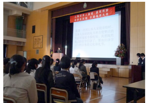
中日スピーチ大会当日の様子

本大会は1997年に日中国交正常化25周年を記念して開始され、中学部が浦東校に移ってからも途切れることなく続いている歴史ある大会である。中国の中学生は日本語でスピーチを行い、日本の中学生は中国語でスピーチを行う独自の大会で、お互いに相手の国の言葉を使ってスピーチを行う。例年、中学生が様々なテーマや切り口で、母語とは違う言語で考え方を発表する。