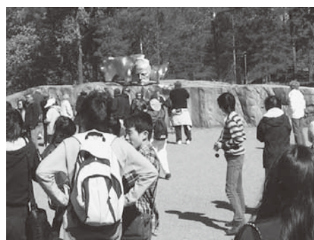
シベリウス公園訪問。