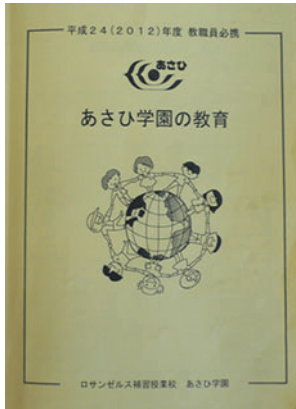
あさひ学園の教育

※昨年度は小学校で、今年度は中学校で新学習指導要領が導入されたので、その趣旨を説明し、各講師には知識・ 理解の部分だけではなく、思考・判断・表現、技能の部分についての学習活動も授業の中に取り入れられるよ う指導した。また、各校に小中学部全ての教科のデジタル教科書、プロジェクター、実物投影機を配置し、講 師に活用してもらえよう研修をした。