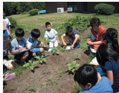
小3理科の授業の観察

毎年6月に希望者を募り、シカゴ日本人学校へ研修に出かけている。補習授業校では、普段他の講師の授業を参観することは不可能である。日本の本場の教員が行っている授業実践を見ることが出来る貴重な体験である。日本人学校と補習授業校では異なる部分も多いが、参加者は大きな刺激を受けていた。