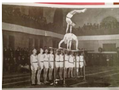
写真3 大体育館内部で行われていた体操

リーを設計し、観客を意識し、人々が集まることや観戦することが考えられていることが、日本と異なるスポーツ文化として成熟していったのだろう。