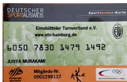
写真1 左下がハンブルクスポーツ連盟、右下がDOSBのロゴ

ドイツでは学校教育の一貫としてのスポーツの部活動は原則として行われていない。ドイツにおける青少年のスポーツ活動の核は地域のスポーツフェラインであり、彼らはそこで中高齢者に至るまで週1～2回程度スポーツ活動を実践する。地域のスポーツフェラインへ加入すると、州スポーツ連盟およびドイツオリムピックスポーツ連盟（DOSB：Deutscher Olympischer Sportbund）の会員として登録されると同時に、自分の参加するスポーツ種目の競技連盟へ登録される。登録すると、会員証をもらうが、そこには州スポーツ連盟とDOSBのロゴも印字されている（写真1）。