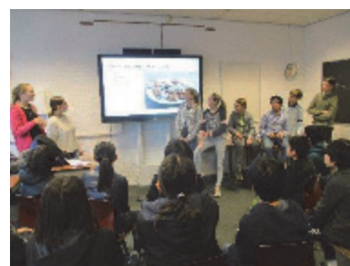
現地校との交流学習

学校の教科書も、無償のもの（紙の教科書）は持ち帰ることができず、学校保管になるため、無償のデジタル教科書をモバイルPC に入れている。学校で使用される課題の多くは、インターネット経由で配布されるため、電子学習環境、デジタル学習教材が充実している。生徒は学習プロセスにおいてより、積極的に参加型の役割を割り当てられる。教師が指定したフレームワークを、デジタルツールを使用しながら、ICT の助けを借りて、生徒は協働的に解決していく学習形態ができている。